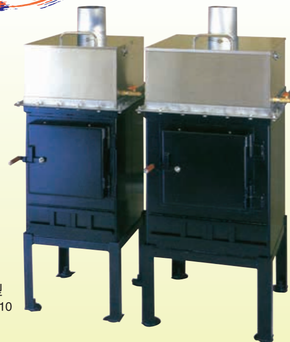
NT10型 NT Type10