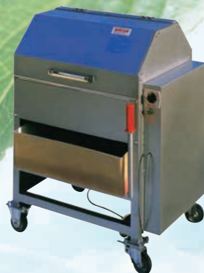
☆安全カバー付 Safety cover

Any shape net will be cleaned spotless front and back simultaneously.