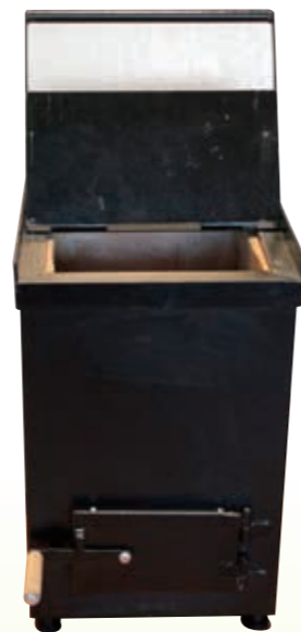
NT5型 NT Type5